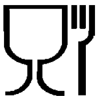
Рисунок А.1– Для пищевых продуктов

А.2 Символ и знаки, наносимые на изделия и / или упаковочный ярлык, характеризующие бутылки по назначению, – см. рисунки А.1 и А.2.