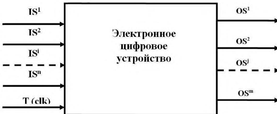
Рисунок 1 – Физическое представление устройства

6.1.4 Работа устройства тактируется одним из входных сигналов либо от одного внутреннего генератора, входящего в состав устройства. На входные контакты краевых разъемов могут подаваться входные цифровые тестовые воздействия, а с выходных контактов этих разъемов может быть снята реакция (выходные цифровые сигналы) устройства на входные воздействия. Сопоставление полученных реакций с эталонными позволяет сделать вывод о работоспособности ОК и осуществлять диагностику обнаруженных неисправностей. Совокупность входных воздействий и соответствующие им эталонные реакции ОК представляют собой тест.