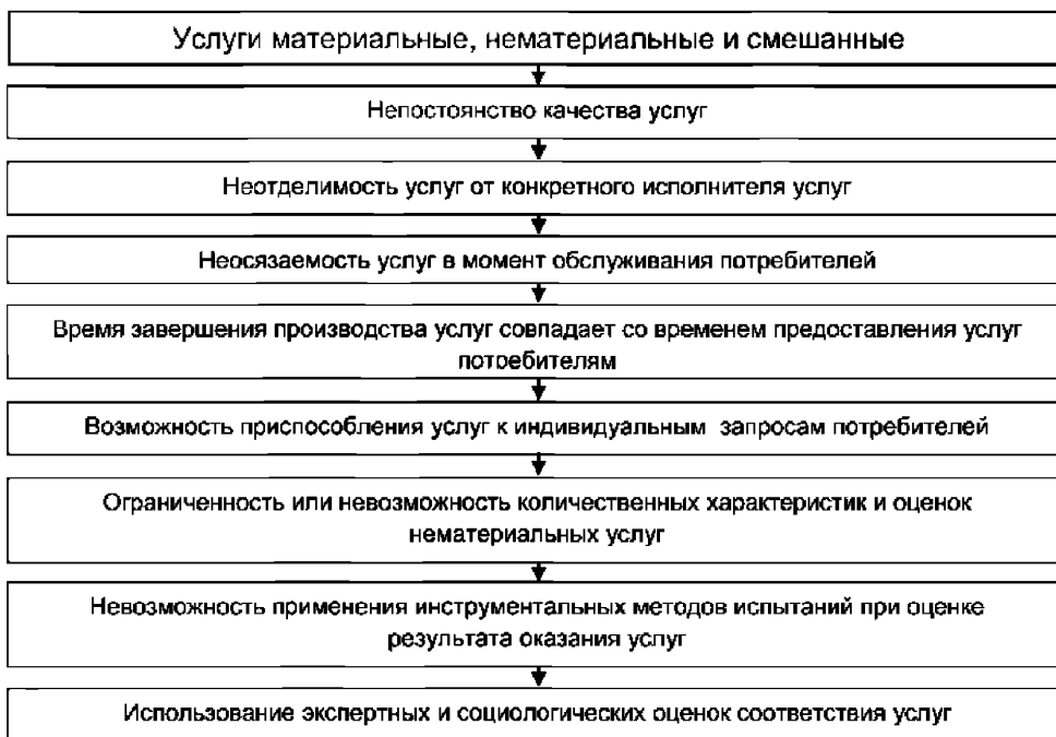
Рисунок 2 — Специфические особенности услуг

Поэтому при разработке и внедрении системы менеджмента качества в организациях, предоставляющих услуги населению, необходимо учитывать особенности сферы услуг.