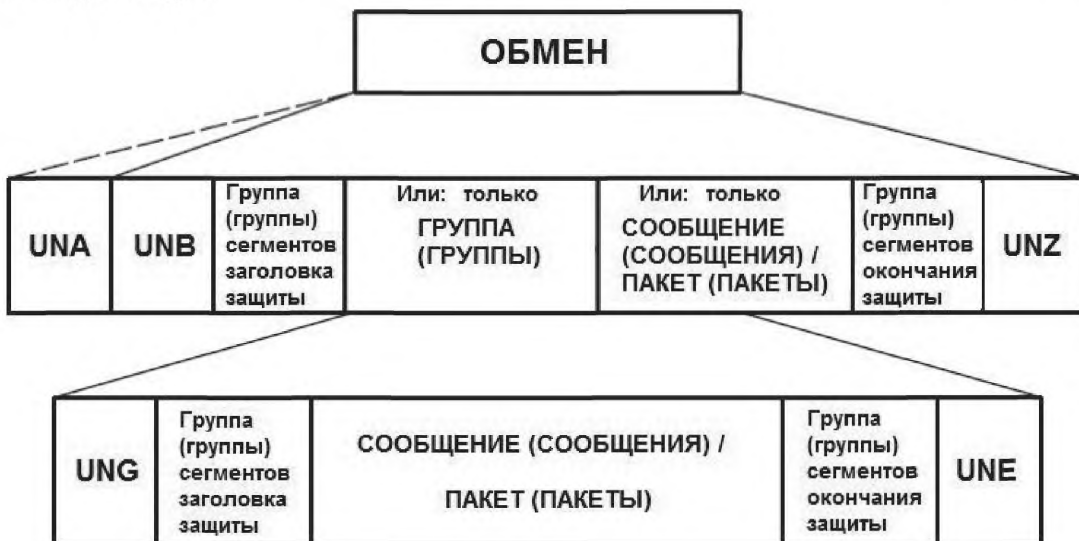
Рисунок 5 – Схематическое представление обмена, обеспечивающее защиту как на уровне обмена, так и на уровне групп

На рисунке 5 приведена схема обмена, при которой обеспечена защита как на уровне обмена, так и на уровне групп.