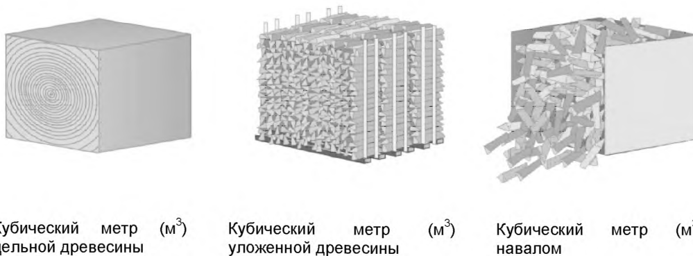
Рисунок В.1 – Сравнение различных кубических метров

П р и м е ч а н и е — Три кубических метра навалом примерно соответствуют двум кубическим метрам уложенной древесины.