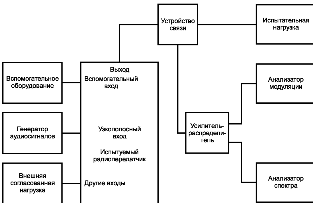
Рисунок 2 — Конфигурация оборудования при испытаниях: ДВ, СВ, КВ АМ радиовещательные передатчики