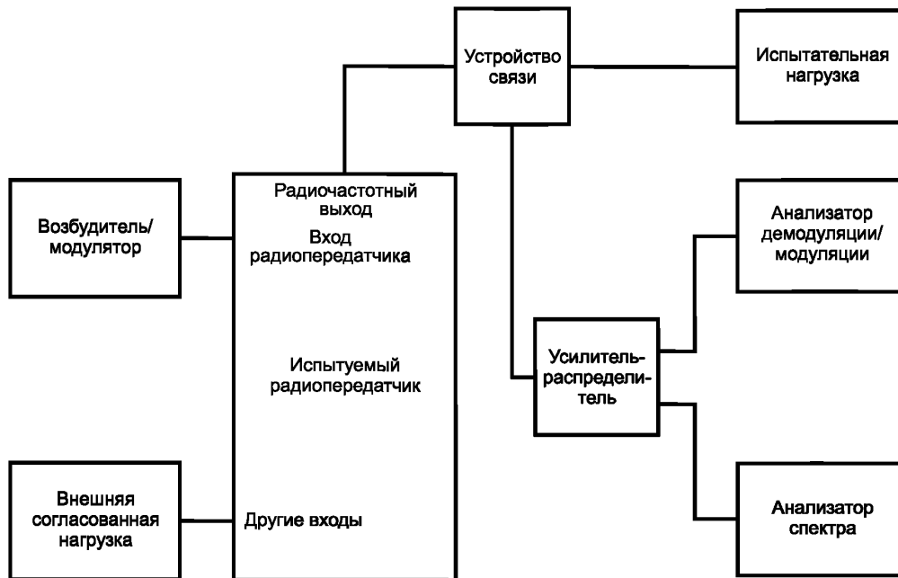
Рисунок 3 — Конфигурация оборудования при испытаниях: радиовещательные передатчики DRM [2] и T-DAB [3]