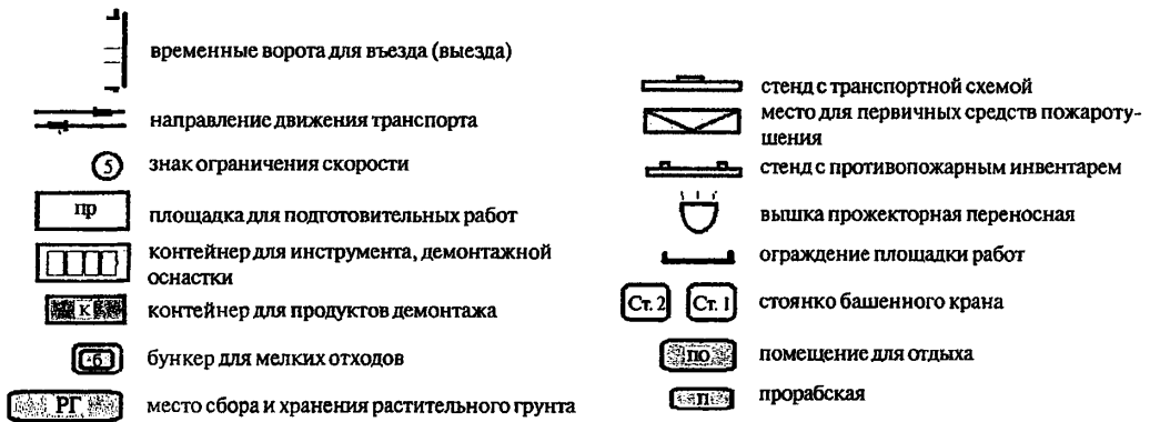
Рисунок 2 — Обустройство площадки демонтажных работ

Площадка имеет временное (из инвентарных секций) ограждение с въездными воротами и знаками, ограничивающими скорость автотранспорта и указывающими направление движения. Въезд на площадку размещен стенд с транспортной схемой движения.