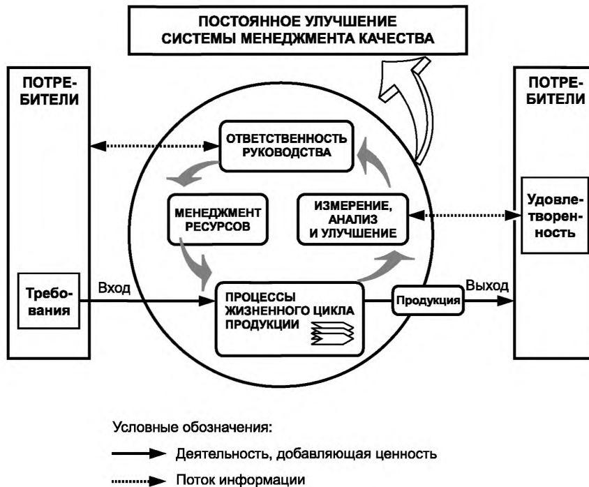
Рисунок 2 — Модель системы менеджмента качества, основанной на процессном подходе

На диаграмме ресурсы показаны соответствующим блоком в ее левой части. Адекватные ресурсы помогают обеспечить качество сельскохозяйственной продукции. Ресурсы включают, например, землю, рабочее пространство, оборудование, материалы (входные данные) и персонал. Обеспечение того, что люди подготовлены, обучены и компетентны для выполнения требуемых от них задач, является также составным элементом, относящимся к выделению ресурсов.