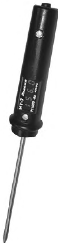
Рисунок Б.1 — Цифровой переносной термометр-щуп ИТ-7

Б.1 Цифровой переносной термометр-щуп приведен на рисунке Б.1.