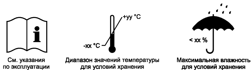
Рисунок 2 — Пиктограммы

в) рекомендуемые изготовителем условия хранения (температура и влажность) или эквивалентная пиктограмма согласно рисунку 2.