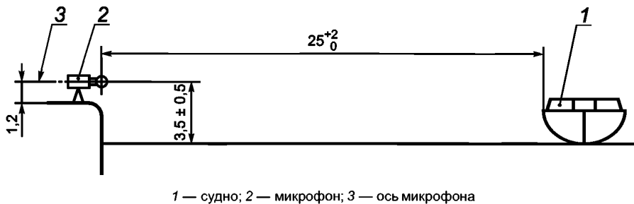
Рисунок 2 — Положение микрофона

9.1.3 Расстояние от микрофона до обращенного к нему борта судна должно быть 25^{+2}_0 м. Контроль расстояния производят при каждом проходе судна.