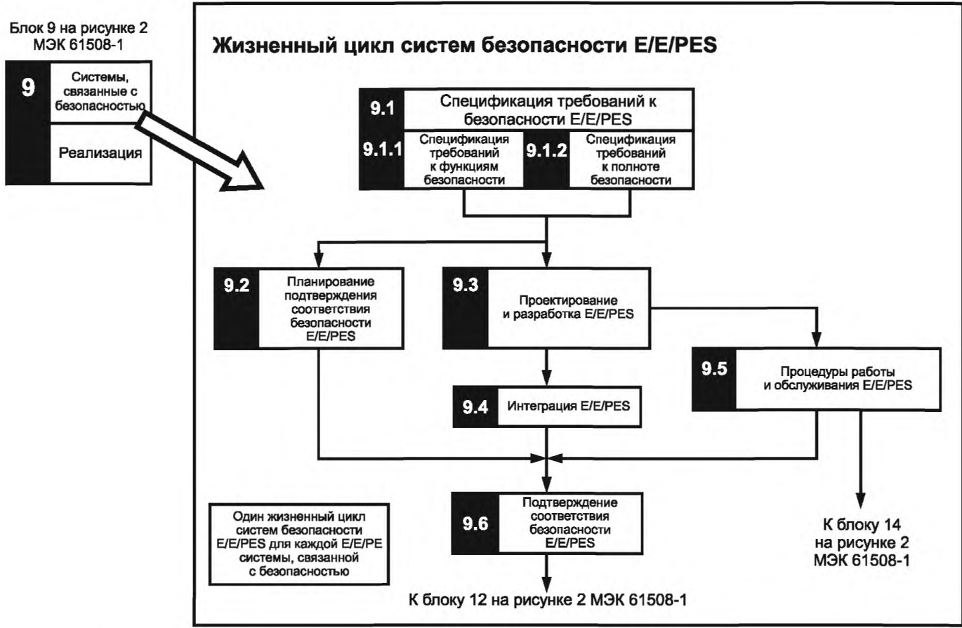
Рисунок 2 — Жизненный цикл безопасности E/E/PES систем (стадия реализации)