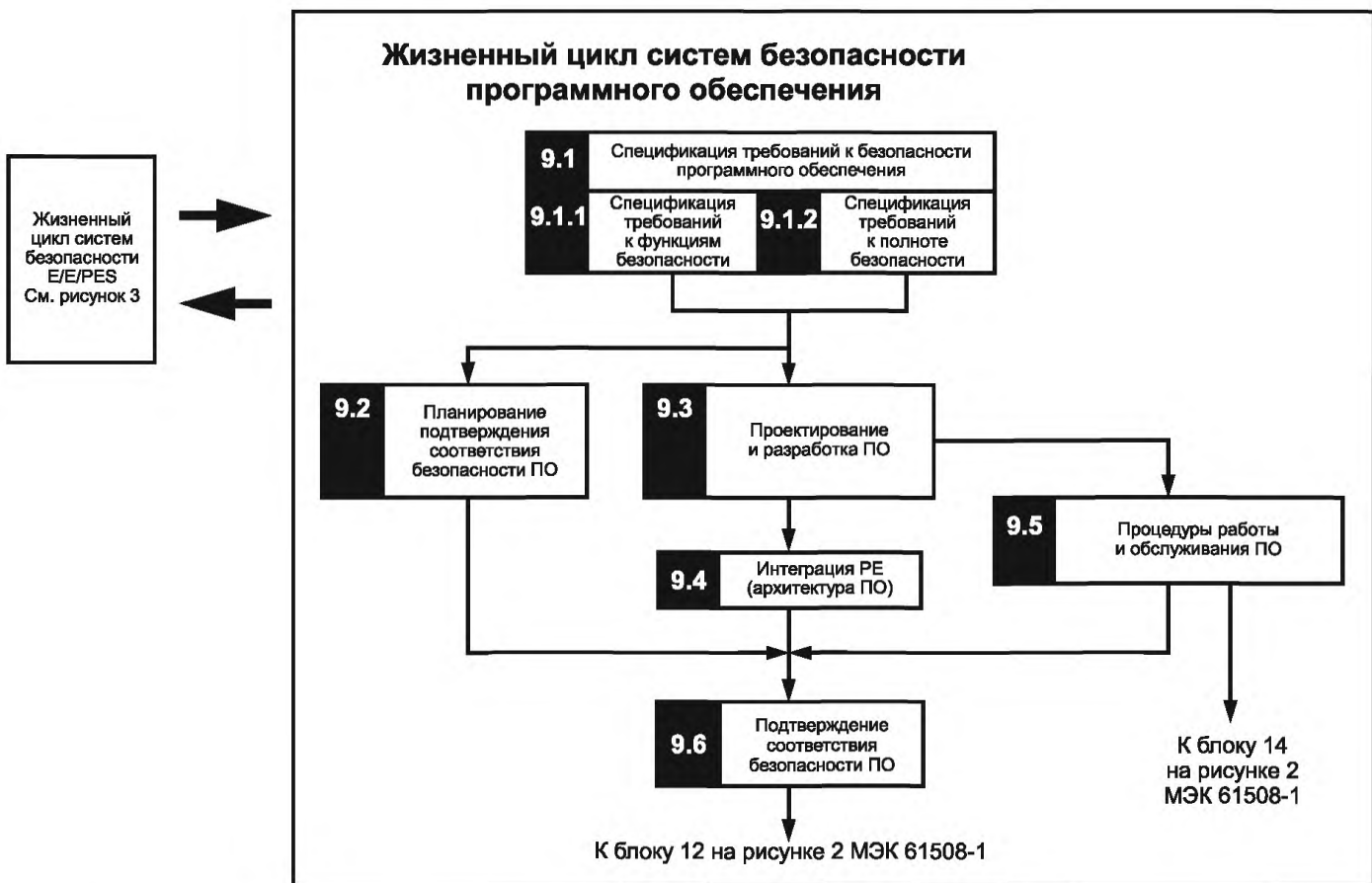
Рисунок 3 — Жизненный цикл безопасности программного обеспечения (стадия реализации)