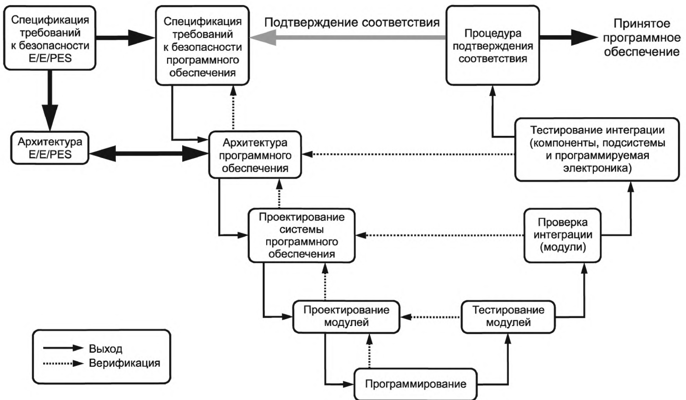
Рисунок 5 — Полнота безопасности программного обеспечения и жизненный цикл разработки (V-модель)