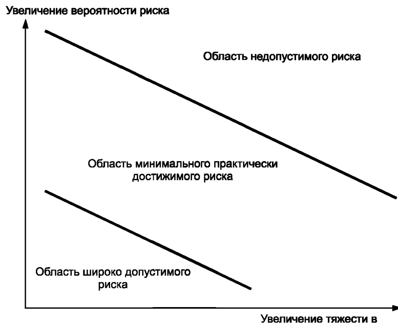
Рисунок Е.1 –Схематическое представление трех областей риска

При определении риска рекомендуется рассматривать инициирующие происшествия или обстоятельства, последовательность нежелательных событий, любые смягчающие факторы, а также характер и частоту возможных вредных последствий идентифицированных опасностей. Риск следует определять в терминах, облегчающих принятие решений по управлению риском. При анализе риска рекомендуется его компоненты, т.е. вероятность и тяжесть, рассматривать раздельно.