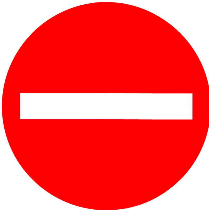
Рисунок 2 — Индикатор «Вход запрещен»