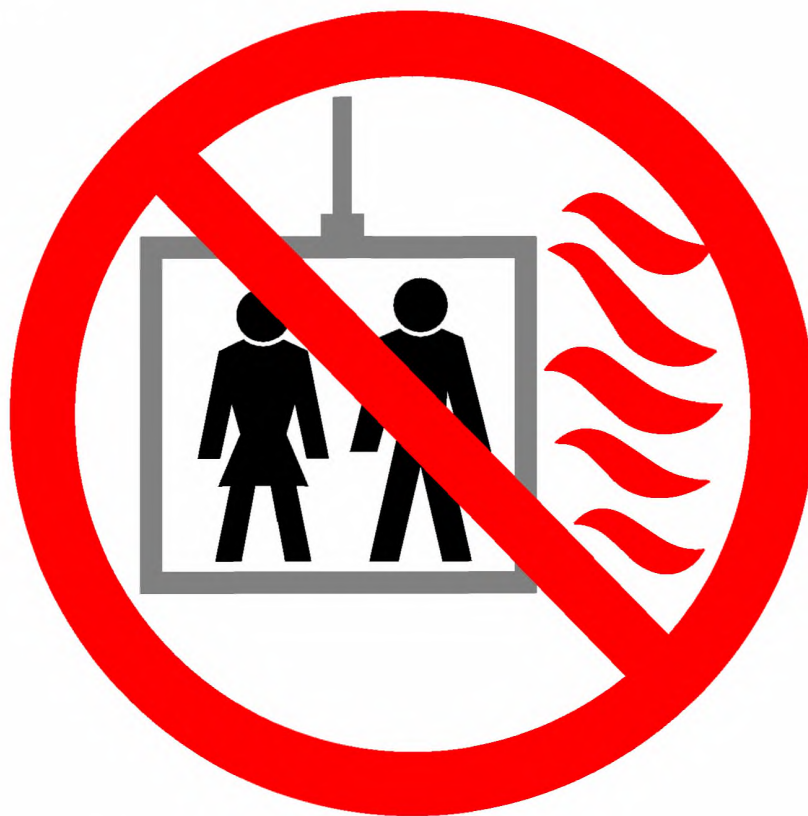
Рисунок 1 — Пиктограмма «Пользование лифтом во время пожара запрещено»

П р и м е ч а н и е — При необходимости на пиктограмме может быть приведен следующий текст: «Пользование лифтом во время пожара запрещено».