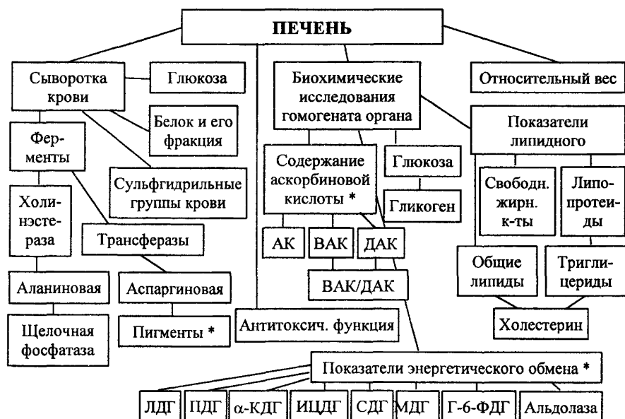
СХЕМА 4. Изучение функционального состояния печени.