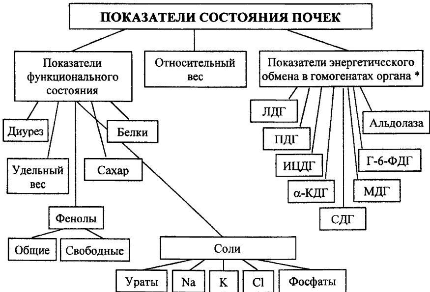
СХЕМА 6. Изучение функционального состояния почек.