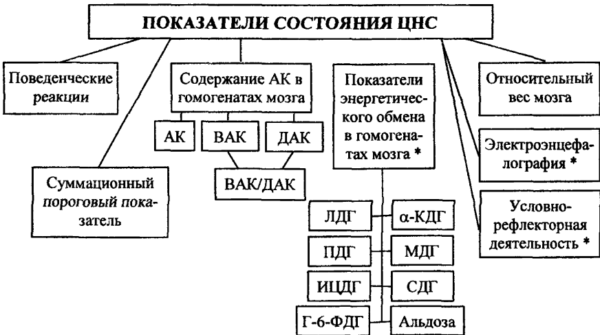
СХЕМА 2. Изучение функционального состояния центральной нервной системы.