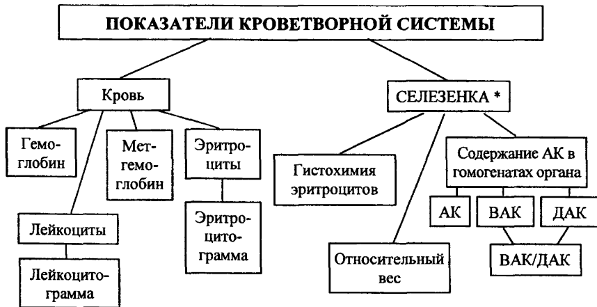
СХЕМА 7. Изучение функционального состояния кроветворной системы.