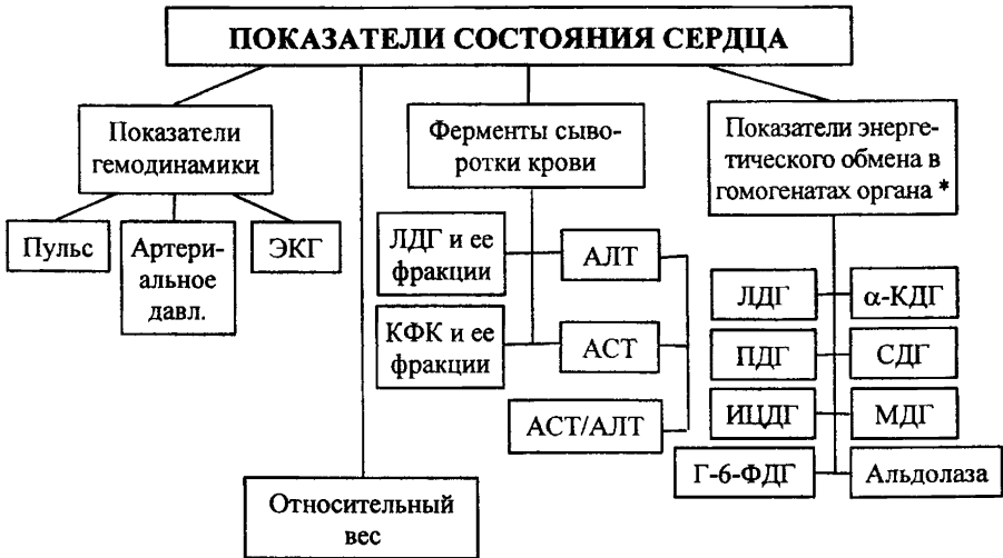
СХЕМА 5. Изучение функционального состояния сердца.