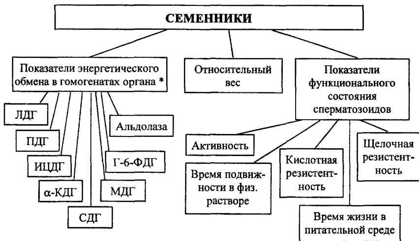
СХЕМА 8. Изучение гонадотропного действия факторов.