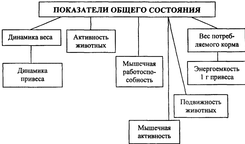
СХЕМА 1. Изучение общего состояния подопытных животных.