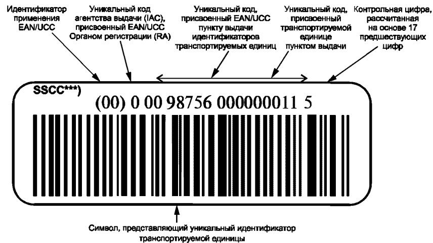
Рисунок В.1 — Пример представления уникальной идентификации транспортируемых единиц в символике штрихового кода EAN/UCC 128 с идентификатором применения EAN/UCC «00» и визуальным представлением знаков

В.1 Пример представления уникальной идентификации транспортируемых единиц в символике штрихового кода EAN/UCC 128* с идентификатором применения EAN/UCC** «00» и визуальным представлением знаков приведен на рисунке В.1.