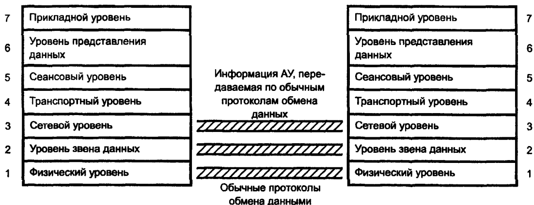
Рисунок А.3 — Операции (N)-уровня

Стандарты по операциям (N)-уровня несут ответственность за группу стандартов соответствующих уровней ВОС.