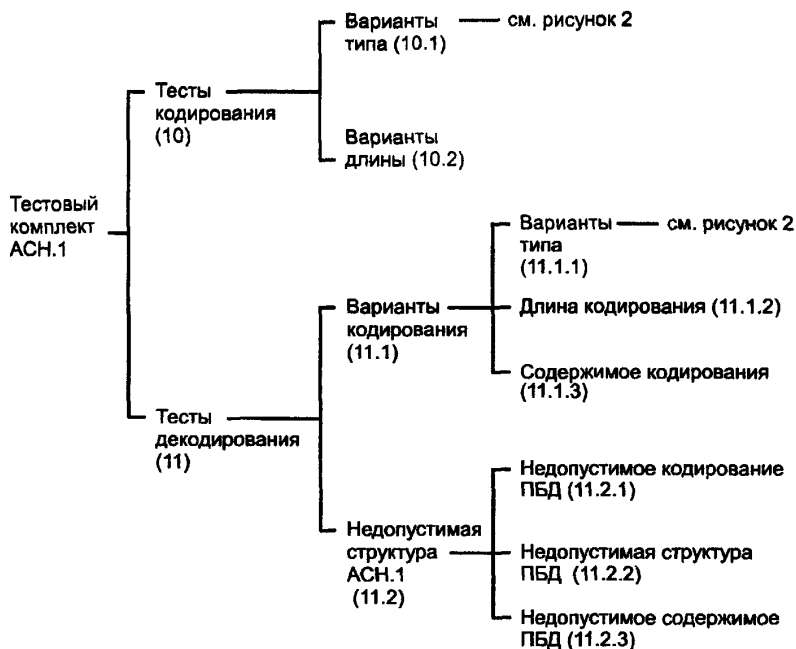
Рисунок 1 — Структура тестового комплекта АСН.1

Каждая из этих групп подразделена на ряд тестовых групп более низкого уровня. Полная структура большинства тестовых групп дана на рисунках 1 и 2.