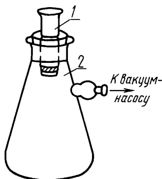
1 — тигель или воронка стеклянные фильтрующие; 2 — колба для фильтрования под вакуумом