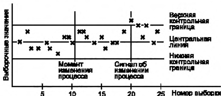
Рисунок 1 — Пример применения контрольной карты для случая, когда длина серии выборок равна 10 выборкам между моментом изменения процесса и сигналом об его изменении

значение промежутка времени, в течение которого КК не покажет, что процесс вышел из управляемого состояния. Причем, иногда фактическая длина серии выборок может быть больше или меньше ARL .