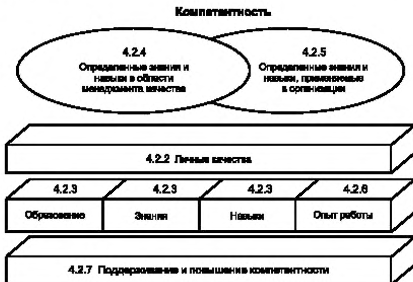
Рисунок 1 — Концепция компетентности консультанта по системам менеджмента качества

Примечание — Термин «компетентность» определен в ИСО 9000 как выраженная способность применять свои знания и умение.