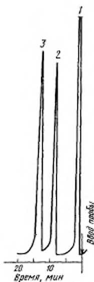
Хроматограмма фенолокрезолоформаль- дегидных смол

1—растворитель; 2—де- циловый спирт; 3—фенол