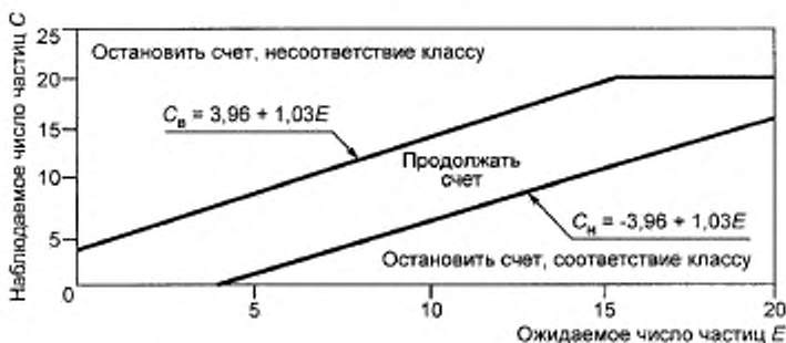
Рисунок F.1 — Границы соответствия и несоответствия классам чистоты при использовании метода последовательного отбора проб

На рисунке F.1 по оси абсцисс отложены значения ожидаемого числа частиц E , если концентрация частиц равна максимально допустимому значению для заданных размеров частиц и класса чистоты (В.4.2). По оси ординат отложены значения наблюдаемого числа частиц C в пробе.