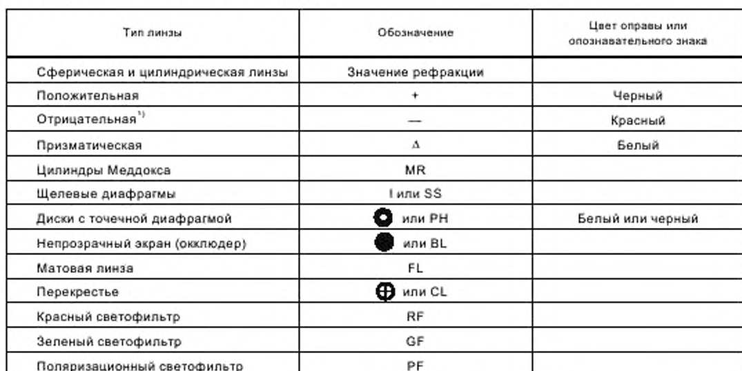
Таблица 7 — Опознавательные знаки линзы

1) В случае пересечения цилиндров оси отрицательного цилиндра должны быть маркированы красным цветом.