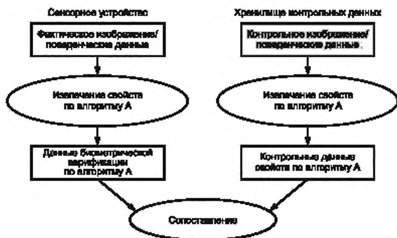
Рисунок А.1 — Использование данных изображений/поведенческих данных

Структуры обмениваемых данных, установленных в комплексе ИСО/МЭК 19794, используют в сценариях в зависимости от их уровня обработки.