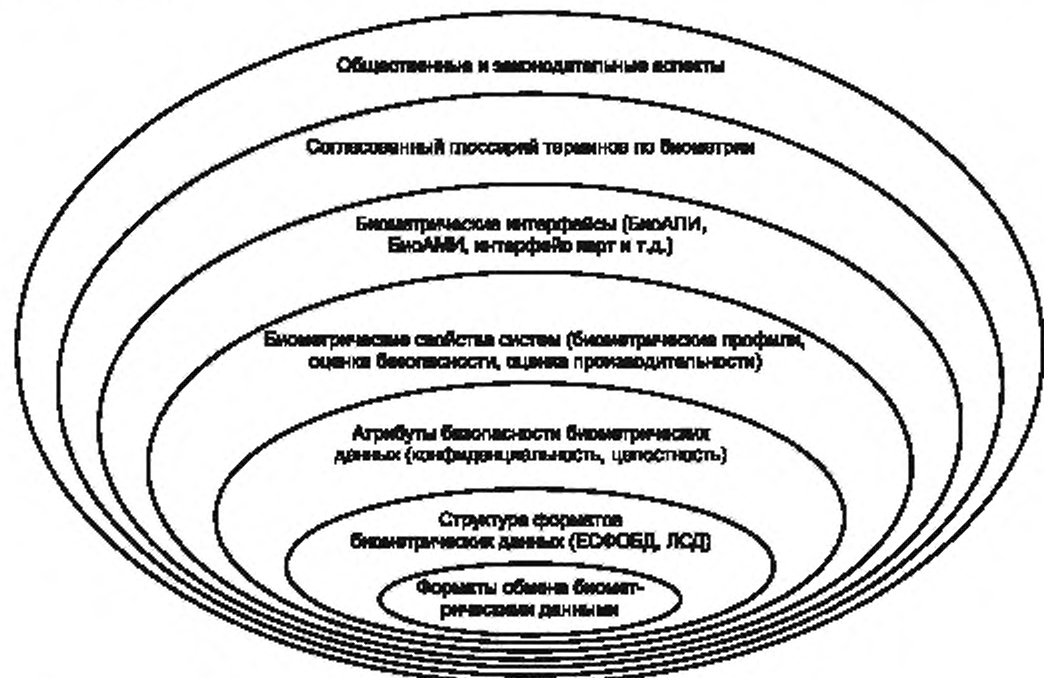
Рисунок 1 - Области стандартизации, относящиеся к биометрии 1)

Взаимосвязь областей стандартизации ИСО/МЭК, имеющих отношение к биометрии, представлена на рисунке 1. Возможность использования биометрической информации зависит от соответствия биометрических данных формату обмена, установленному в настоящем стандарте. Форматы обмена биометрическими данными, установленные в ИСО/МЭК 19785—2007 «Автоматическая идентификация. Идентификация биометрическая. Единая структура формата обмена биометрическими данными», являются непосредственной оболочкой биометрических данных. Поскольку биометрические данные являются конфиденциальными и могут стать объектом кражи или атаки, среды обмена данными должны быть обеспечены средствами защиты информации. Оценка биометрических параметров с точки зрения профилей, уровня безопасности и производительности также является важной составляющей формата обмена биометрическими данными. Интеграция и возможность использования биометрических компонентов требует наличия интерфейсов форматов биометрических данных. При описании технологий обработки биометрических данных рекомендуется придерживаться установленных в комплексе стандартов ИСО/МЭК 19794 формулировок. При развертывании приложений, использующих биометрическую верификацию или идентификацию, необходимо учитывать социальные и юридические требования, которые действуют на конкретной территории и зависят от местной специфики.