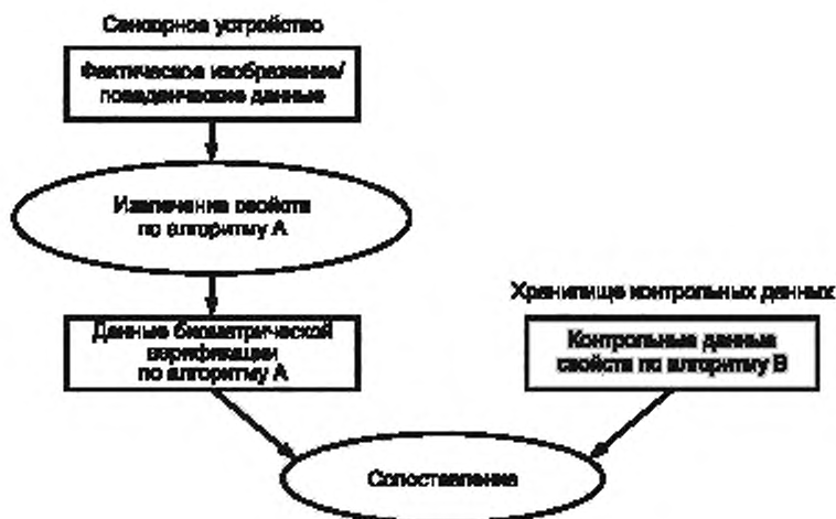
Рисунок А.2 — Использование данных свойств