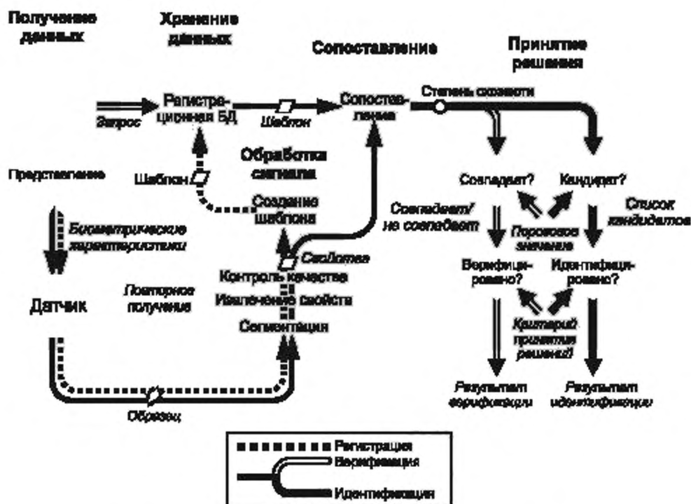
Рисунок 2 — Компоненты обобщенной биометрической системы