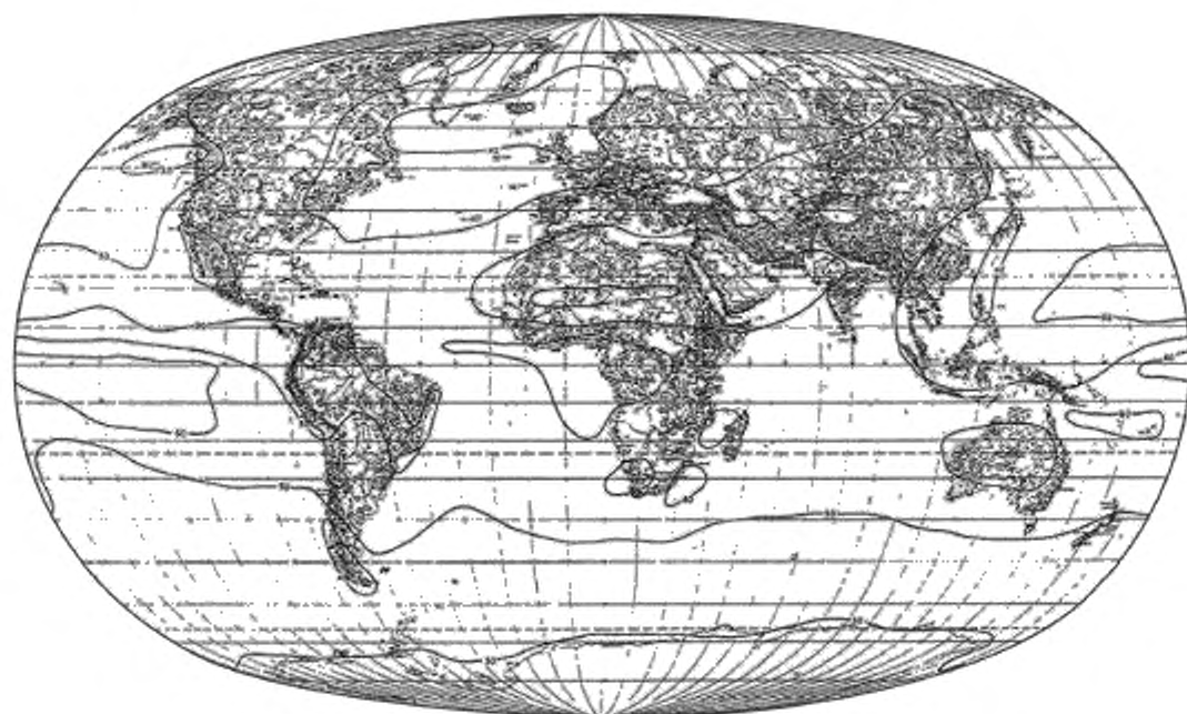
Рисунок А.3 — Средняя энергетическая суточная экспозиция за год (в процентах)