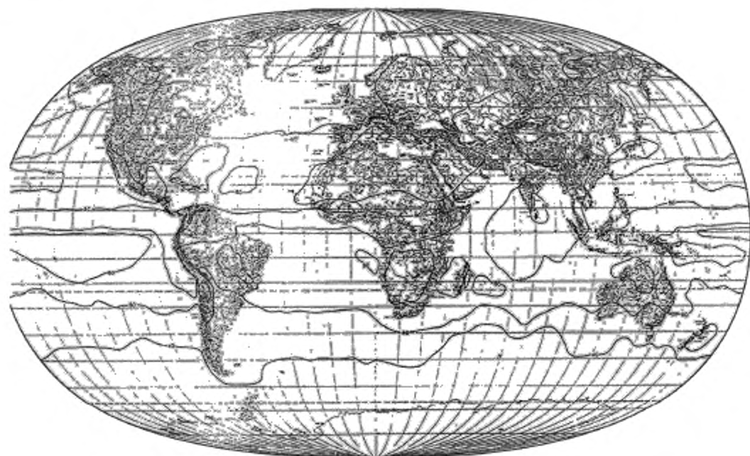
Рисунок А.1 — Средняя энергетическая суточная экспозиция за июнь (в процентах)