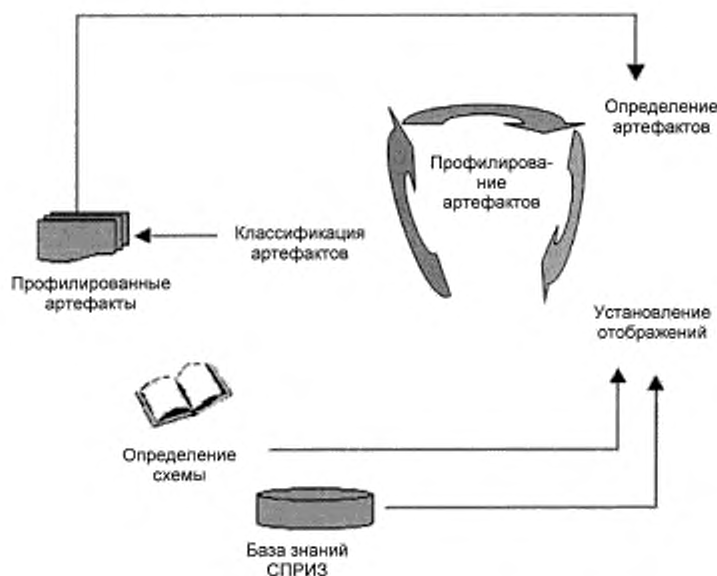
Рисунок 2 — Профилирование артефактов

Данный многоступенчатый процесс является итеративным. Определение артефакта может изменяться с течением времени по мере получения новых знаний об артефакте и внесения изменений в определение СПРИЗ.