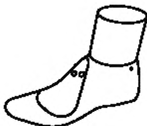
Рисунок А.3 — Берцовая колодка