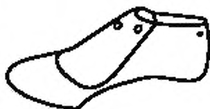
Рисунок А.1 — Колодка с профилированным рельефом следа

Типы обувных ортопедических колодок показаны на рисунках А.1—А.3.