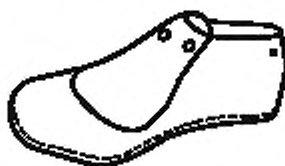
Рисунок А.2 — Колодка с плоским следом