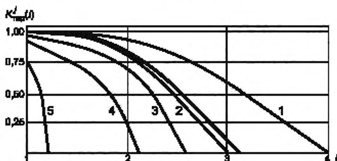
Рисунок 2 — Зависимость K(i) , нанесенная на серию тарифовочных кривых

10.3 Строят график зависимости K(i) и наносят его на серию тарифовочных кривых (рисунок 2).