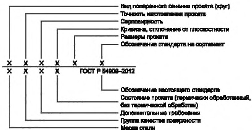
Схема условных обозначений длинномерной и плоской металлопродукции из клапанной стали

Пример условного обозначения прутка горячекатаного круглого, обычной точности прокатки (N), допуска на длину класса (O), обычной кривизны (A), диаметром 40 мм по стандарту [6], из стали марки X 45 CrSi 9 3, группы качества поверхности 3, термически обработанного (TO) по ГОСТ Р 54909—2012: