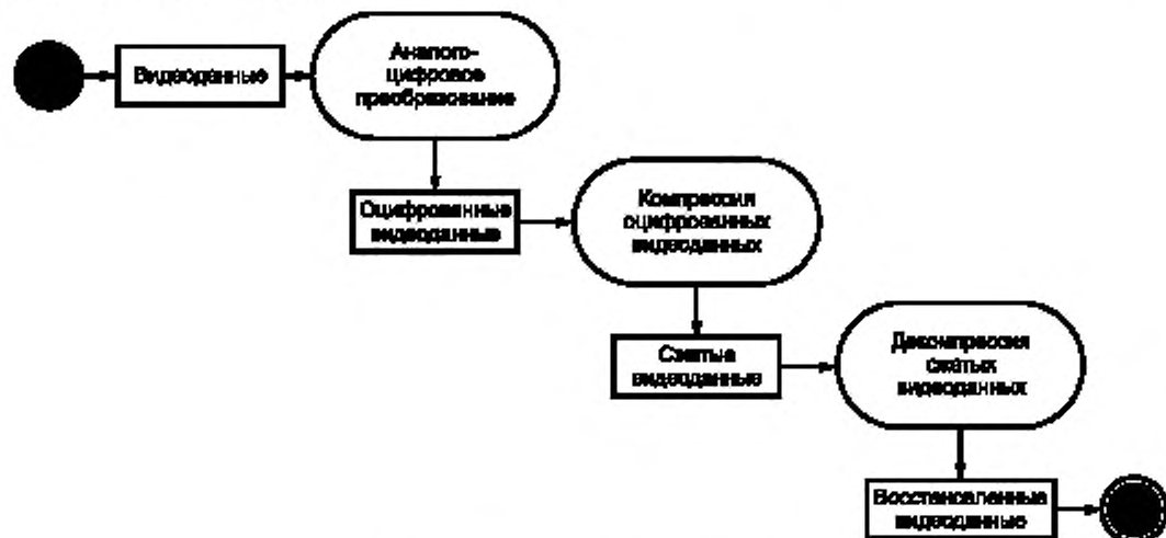
Рисунок 1 — Общая схема работы ЦСОТ

Общая схема работы ЦСОТ с точки зрения использования алгоритмов компрессии и декомпрессии представлена на рисунке 1.