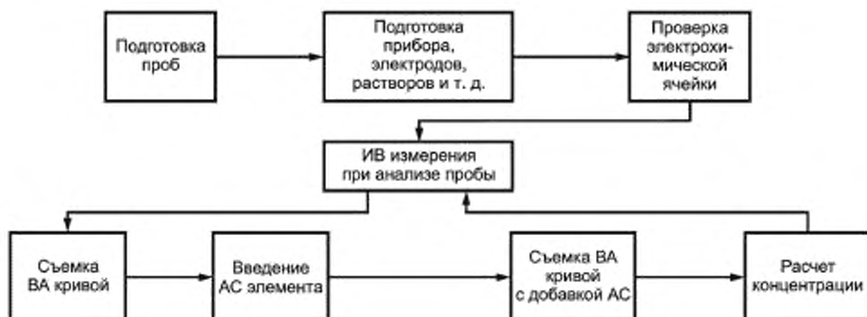
Рисунок 1 — Основные этапы анализа проб ИВ методом

ИВ метод измерений основан на способности йодид-ионов накапливаться на поверхности РПЭ в виде малорастворимого соединения со ртутью при определенном потенциале с последующим катодным восстановлением осадка при изменении потенциала. Аналитическим сигналом является величина катодного тока пика при потенциале минус (0,30 \pm 0,05) В, который пропорционален концентрации йодид-ионов. Массовую концентрацию йодид-ионов рассчитывают по методу добавки АС йодид-ионов. Общая схема анализа проб ИВ методом представлена на рисунке 1.