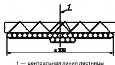
1 — центральная линия лестницы