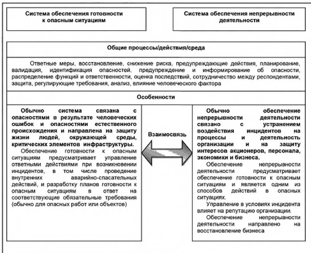
Рисунок 2 — Взаимосвязь элементов системы обеспечения готовности к опасным ситуациям и инцидентам и обеспечения непрерывности деятельности

Взаимосвязь элементов систем обеспечения готовности к опасным ситуациям и инцидентам и обеспечения непрерывности деятельности приведена на рисунке 2. Данная схема предназначена только для информации.