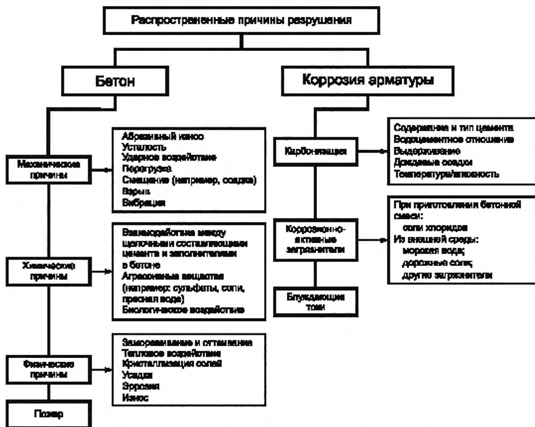
Рисунок 1 — Распространенные причины разрушений конструкций

Дальнейшей оценке подлежат примерный объем и вероятная интенсивность прироста дефектов. Следует определять, когда бетонная конструкция или ее элемент больше не будут функционировать так, как предполагалось, без принятия мер по защите или ремонту (не считая мер технического обслуживания находящихся в эксплуатации систем).