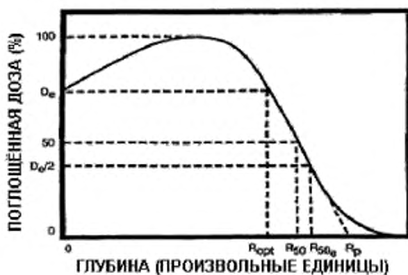
Рисунок 3 – Типичное (идеализированное) распределение дозы по глубине для электронного пучка в однородном материале, состоящем из элементов с низким атомным номером

3.1.9 распределение дозы по глубине (depth-dose distribution): Изменение поглощенной дозы с глубиной, отсчитываемой от наружной поверхности материала, подвергаемого облучению данным видом радиации (типичное распределение см. на рисунке 3).