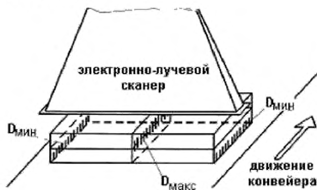
Рисунок 4 – Области D_{\max} и D_{\min} (показанные штриховкой) для случая прямоугольной технологической загрузки при одностороннем облучении электронным пучком

11.5.1.2 Условия облучения — В зависимости от насыпной плотности, толщины, неоднородности технологической загрузки, некоторые технологии могут требовать применения двустороннего облучения для достижения приемлемого значения коэффициента неравномерности дозы [3], см. также руководство ISO/ASTM 51649. В случае двустороннего облучения области максимальной и минимальной доз могут быть совершенно другими по сравнению с односторонним облучением (см. рисунки. 4 и 5 для облучения электронным пучком). В связи с этим при электронном облучении необходимо соблюдать осторожность при двустороннем (или многостороннем) облучении, поскольку небольшое изменение толщины или насыпной плотности технологической загрузки или энергии электронов может привести к созданию неприемлемой дозы вблизи центра технологической загрузки. В случае облучателей сплошного потока равномерность поглощенной дозы может быть улучшена путем размещения отражателей для регулирования потока продукта через зону облучения.