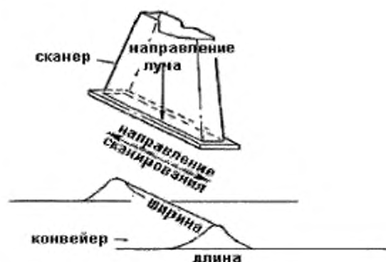
Рисунок 1 – Схема, показывающая длину и ширину сканирующего пучка в конвейерной системе

3.1.4.1 Замечание – (1) Этот термин обычно применяется при электронном облучении. (2) Таким образом, длина пучка перпендикулярна ширине пучка и оси электронного пучка. (3) В случае низкоэнергетического ускорителя электронов с одним зазором длина пучка равна активной длине катодной системы в вакууме. (4) В случае неподвижного во время облучения продукта «длина пучка» и «ширина пучка» могут быть взаимозаменяемы.