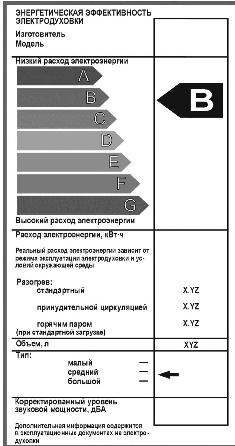
Рисунок А.1 — Маркировка эффективности электрошкафа

А.1 Маркировка представлена на рисунке А.1.