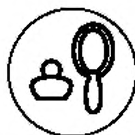
Рисунок А.2 — Укупорочные средства, предназначенные для парфюмерно-косметической продукции