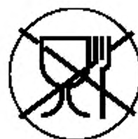
Рисунок А.3 — Укупорочные средства, не предназначенные для контакта с пищевой продукцией