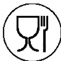
Рисунок А.1 — Укупорочные средства, предназначенные для контакта с пищевой продукцией