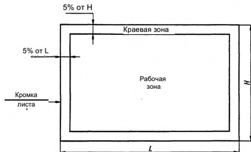
Рисунок 2 – Осматриваемые зоны стекла с покрытием конечного размера