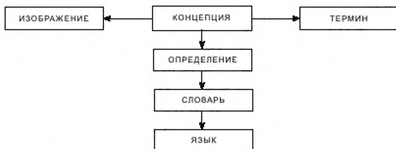
Рисунок 1 — Концептуальная модель терминологии высокого уровня

Примечание 2 – Данная модель не предназначена для использования в качестве модели данных. Модель данных для открытых технических словарей, включая терминологию, приведена в ИСО/ТС 22745-10.