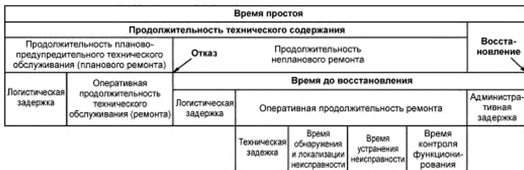
Рисунок А.1 — Составляющие продолжительности технического содержания

Взаимосвязь между составляющими продолжительности технического содержания приведена на рисунке А.1.