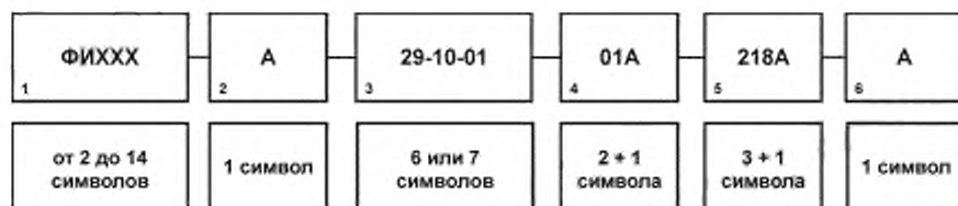
Рисунок А.1 — Структура ОМД

А.3.1 ОМД состоит из структурированного набора элементов, каждый из которых представляется одним или несколькими алфавитно-цифровыми символами (рис. 1).