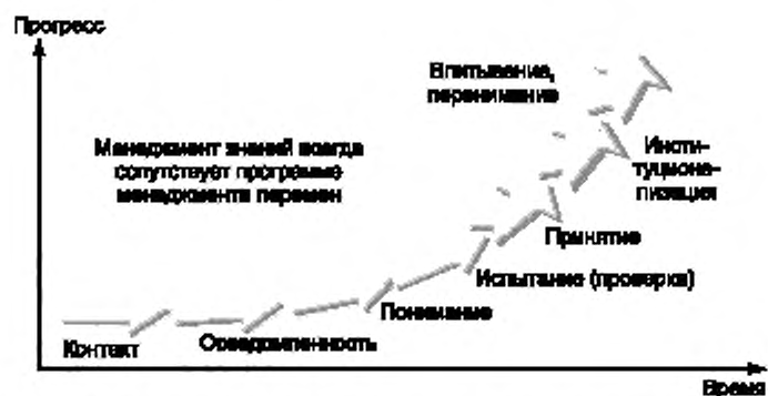
Рисунок 6 – Связь между менеджментом знаний и менеджментом изменения

Представляется также важным знать, где располагается организация на кривой изменения (см. рисунок 6), поскольку это дает представление о достигнутом прогрессе. Как правило, во-первых, на переход от контактной фазы до фазы принятия (в зависимости от характера и размера бизнеса) требуется один или два года. Во-вторых, стратегия, предусматриваемая проектом по МЗ, должна адаптироваться к положению на кривой изменения: слишком часто организации начинают крупномасштабные проекты или проекты, требующие крупных бюджетов, без наличия необходимых инструментов, а иногда даже без обеспечения осведомленности или понимания людьми, которые должны работать по-иному или применять новые инструменты.