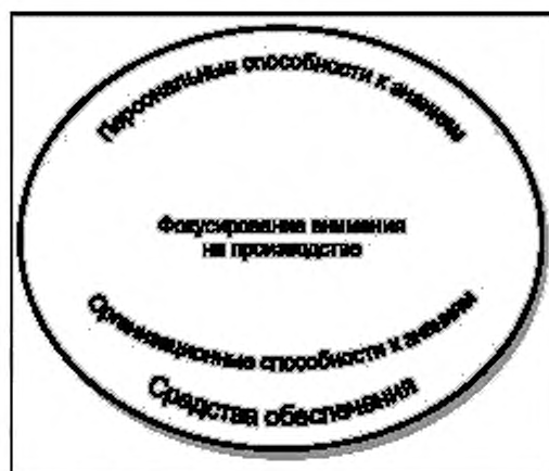
Рисунок 1 – Основа менеджмента знаний: европейская перспектива

2 Пять основных видов деятельности в отношении знаний были идентифицированы как наиболее широко применяемые: идентификация, создание, хранение, обмен знаниями и их применение. Они представляют собой второй компонент основы посредством формирования единого процесса.