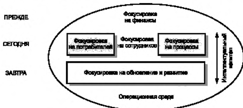
Рисунок 4 – Навигатор Скандиа

Фокусировка на сотрудников является основой организации и имеет большое значение для организации, создающей стоимость. Процесс создания знаний представляется воображаемым именно в этой фокус-области. Представляется также важным удовлетворенность сотрудников своей рабочей ситуацией; удовлетворение сотрудников приводит к удовлетворению потребителей, повышая объем продаж организации и улучшая результаты.