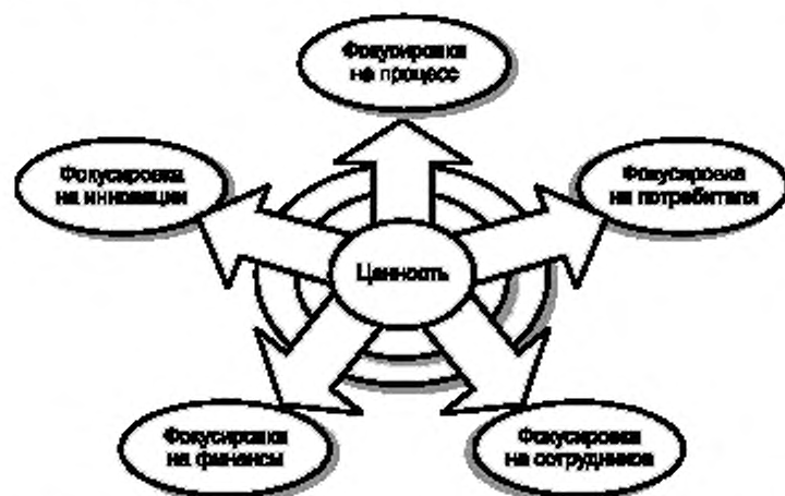
Рисунок 2 – Пять измерений, обеспечивающих добавление ценности в результате применения менеджмента знаний

Сотрудники: многих сотрудников можно рассматривать как создателей знаний. Эффективный МЗ означает для них создание организации, в которой они могут развиваться и использовать свои таланты. МЗ обеспечивает создание среды, в которой работа приносит радость и в которой они могут познавать и делиться знаниями с коллегами, партнерами и потребителями. Это означает, что человеческий капитал (ЧК) организации может эффективно развиваться.