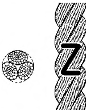
Рисунок 1- Конфигурация 3-рядного крученого каната (тип А)

5.2 Конструкция, изготовление, шаг крутки, маркировка, упаковка и поставляемые длины должны соответствовать ИСО 9554.