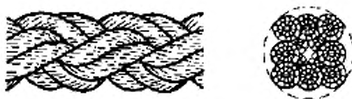
Рисунок 3-Конфигурация 8-рядного плетеного каната (тип L)