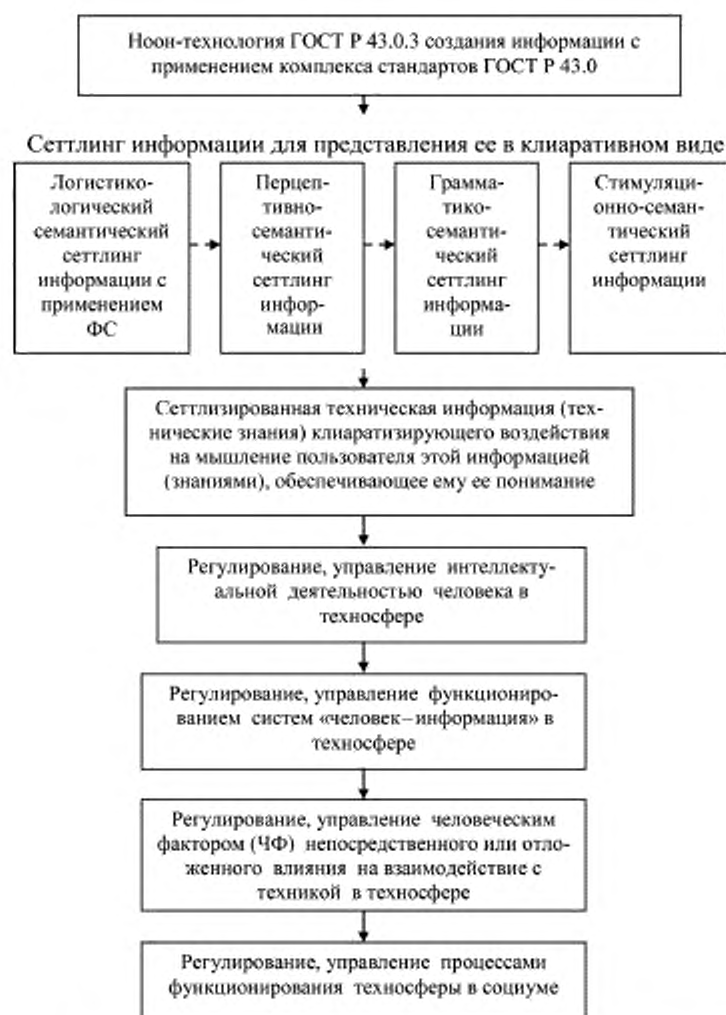
Рисунок А.1 — Схема применения ноон-технологии в регулировании, управлении процессами функционирования техносферы