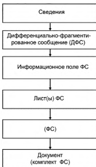
Рисунок Г.1 — Схема создания документов на бумажных носителях информации в виде комплекта бумажных ФС (основной вариант)