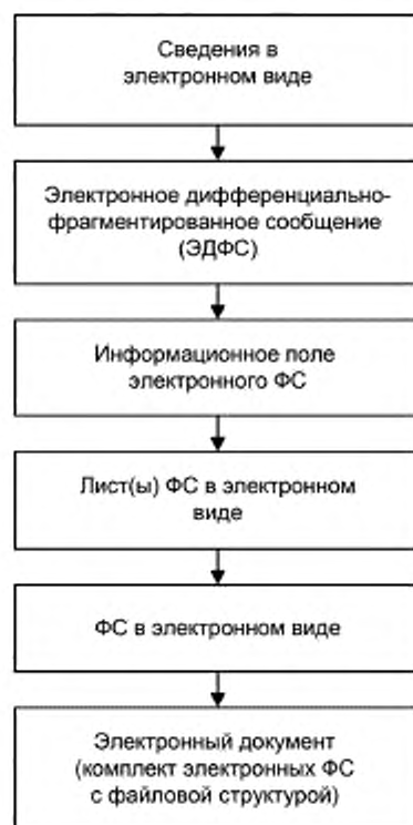
Рисунок Д.1 — Схема создания документов на электронных носителях информации в виде комплекта электронных форматов сообщений