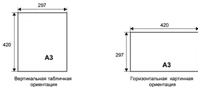
Рисунок В.2 — Ориентация листа ЕТФС при его применении для разработки ФС