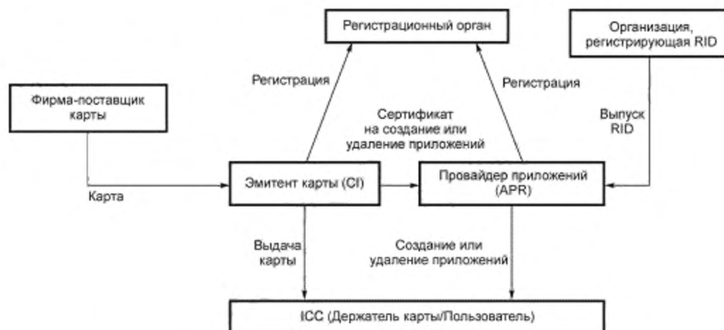
Рисунок А.1 — Модель независимых эмитента карты и провайдера приложения

Примечание — Следующее поколение IC Card System Study Group 1) (NICSS) использует данную модель.