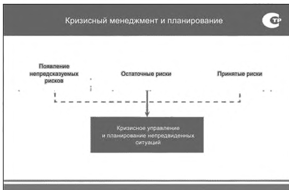
Рисунок 1 — Кризисный менеджмент и планирование

Цель кризисного управления состоит в том, чтобы подготовиться к кризисам так, чтобы наносимый ими ущерб был минимален. Много кризисных событий происходит одинаково и приводит к аналогичным последствиям независимо от того, вызваны ли они различными рисками. В случае если риск, который вызывает кризисные проявления, является вновь возникающим (как это часто бывает), а потому не зафиксированным на стадии идентификации, для такого риска может использоваться план действий для непредвиденных ситуаций.