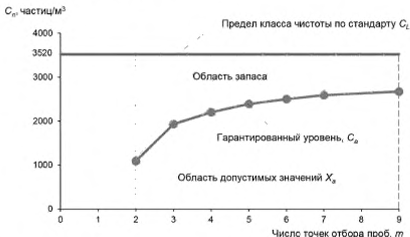
Рисунок А.2 — Гарантированный уровень и область запаса для класса 5 ИСО по частицам с размерами \geq 0,5 мкм ( R = 0,5 )

Преимущество метода по сравнению с методом по ГОСТ ИСО 14644-1 достигается благодаря тому, что не требуется оценивать фактор случайности при каждом испытании. Достаточно это сделать один раз для данного чистого помещения, установив величину C_g .