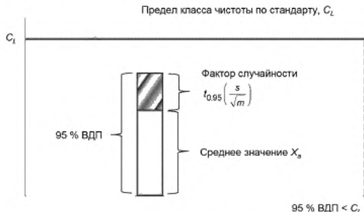
Рисунок А.1 — Графическое представление методики по ГОСТ ИСО 14644-1

Вычисления, учитывающие случайность по ГОСТ ИСО 14644-1, должны проводиться при каждом испытании.