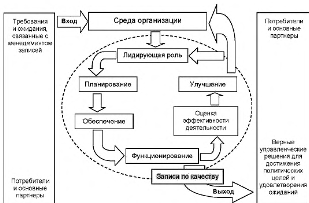
Рисунок 2 — Структура СМЗ