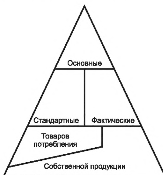
Рисунок D.1 — Типы классов

Отношения между различными типами классов иллюстрируются треугольником на рисунке D.1.